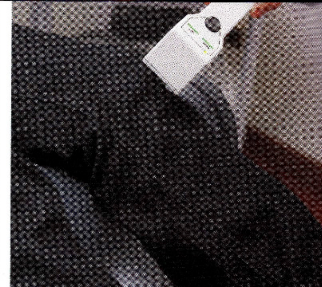
Las ondas son una buena alternativa para tratamientos de lesiones. Su efecto en el organismo permite que los tiempos de rehabilitación se acorten.

"Cuando mapearon el cuerpo humano —agrega— llegaron a constatar que cada órgano, cada tejido, e incluso cada célula, emite y recibe ondas electromagnéticas. La existencia de un flujo eléctrico en el organismo se puede constatar a través de un electrocardiograma. Siempre que hay un flujo eléctrico hay un campo magnético asociado y viceversa. De hecho, la medicina tradicional usa los campos electromagnéticos hace mucho tiempo, por ejemplo una resonancia magnética, el escaner".