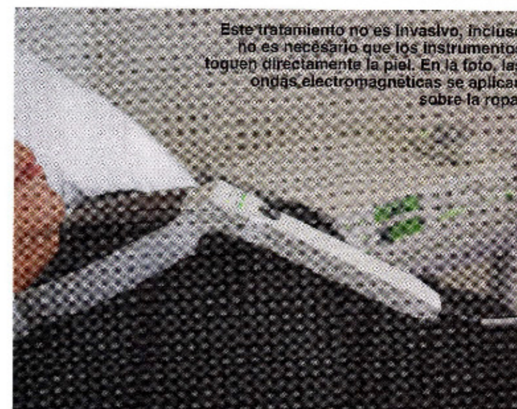
Este tratamiento no es invasivo, incluso no es necesario que los instrumentos toquen directamente la piel. En la foto, las ondas electromagnéticas se aplican sobre la ropa.

—Primero hacemos una evaluación funcional energética, donde se contrastan los patrones normales de electromagnetismo con los del paciente. Si no concuerdan, hay un desequilibrio que provoca una enfermedad. Lo que hacemos con la terapia es equilibrar los patrones electromagnéticos del organismo en los rangos normales. Para que se entienda, podemos hacer la siguiente analogía: cuando escuchas radio, si estás en el espectro exacto de una emisora, el mensaje se escucha bien y claro, pero si uno se empieza a alejar de esa señal, la nitidez se pierde, se escucha con chirridos, está desintonizada. Con el cuerpo humano pasa lo mismo. En la terapia lo que hacemos es volver a sintonizar en la frecuencia que corres-