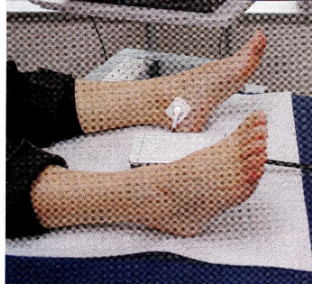
Para hacer el examen diagnóstico se ubican dos electrodos, uno en cada pie, por donde fluyen las frecuencias que hacen la medición de las ondas electromagnéticas.